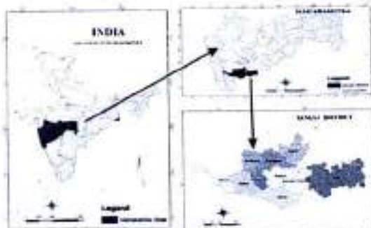
Figure No. 1

For the present investigation the study region is selected by Sangli district (Maharashtra). Sangli District lies in drought-prone area. It is located between 16°, 45'N to 17°, 33'N latitude & 73°, 42'E to 75°, 40'E longitude. It covers area of 8572 sq.km, it