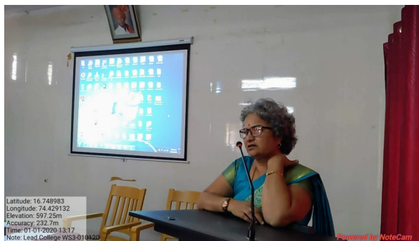
8. Presidential Address