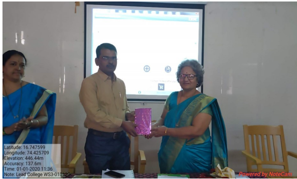
3. Felicitation of Resource Person