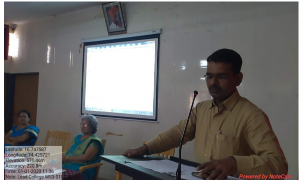
4. Address by Resource Person