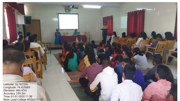
9. Participating students and overall workshop